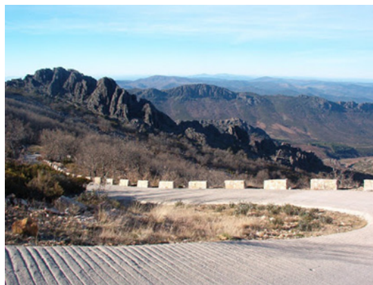
1. Vista de la pista de hormigón y paisaje de la Sierra

En la actualidad está ocupado por una base militar, denominada “CT-2 GUADALUPE - VILLUERCAS - CACERES” (1) , perteneciente al “REGIMIENTO DE TRANSMISIONES ESTRATÉGICAS nº 22 (RETES-22)”, en poco uso, no obstante sigue albergando estratégicas antenas de comunicaciones que llenan la cumbre.