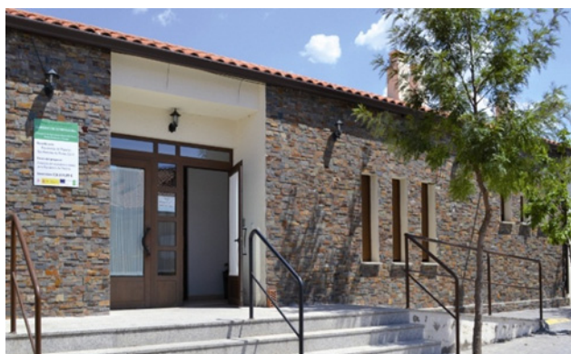
3. Foto.- Residencia geriátrica Aldeacentenera subvencionada en el programa.

La Junta Directiva de APRODERVI , Grupo de Acción Local que gestiona las ayudas bajo enfoque LEADER de la comarca de Villuercas Ibores Jara, dio luz verde ayer a un plan de inversiones en el territorio de 5,7 millones de euros, de los cuales 1,5 proceden de la cofinanciación de fondos públicos del programa de desarrollo rural, provenientes de la Unión Europea (FEADER), el estado y la Comunidad Autónoma.